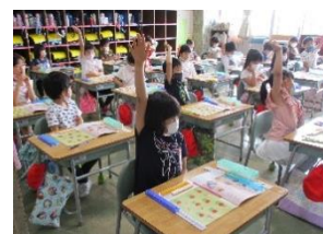
元気よく手を挙げて算数の学習 1年