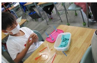
粘土を使って箱の形の学習 3年