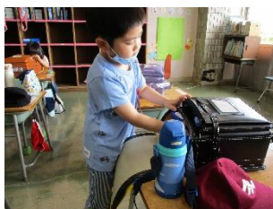
一人で帰りの用意 1年

1年生は、最初の2日間は3時間の勉強でしたが、後半は簡易給食を食べての下校となりました。帰りの用意をするために、大きなランドセルをロッカーから抱えて自分の席に持ってくる姿がとてもほほえましかったです。一週間で手際よく準備を進めることができるようになってきました。