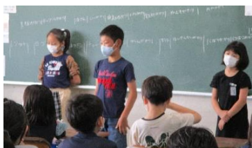
自分たちで進行しての係決め 4年

先週一週間は、学級の係を決めたり、学習の約束を確認したりする姿が見られました。去年の学年の教科書を手にして、3月に残した内容を学習する姿も見られました。