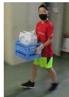
頼もしい給食委員会 6年

来週からは、全学年で通常の給食が始まります。給食調理員さんが、子供たちに安心・安全な給食を食べてもらうよう、工夫をして準備をしてくれています。杉の入小学校の給食は、出汁の味がしっかりとっていて、とてもおいしいと私は感じています。また、給食の片付けが「3密」にならないよう、給食委員会の子供たちも一生懸命、片付けの手伝いをしています。頼りになる高学年です。他の委員会も、今週より本格的にスタートします。